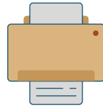
PLASTIFIEUSE + FEUILLE À PLASTIFIÉ